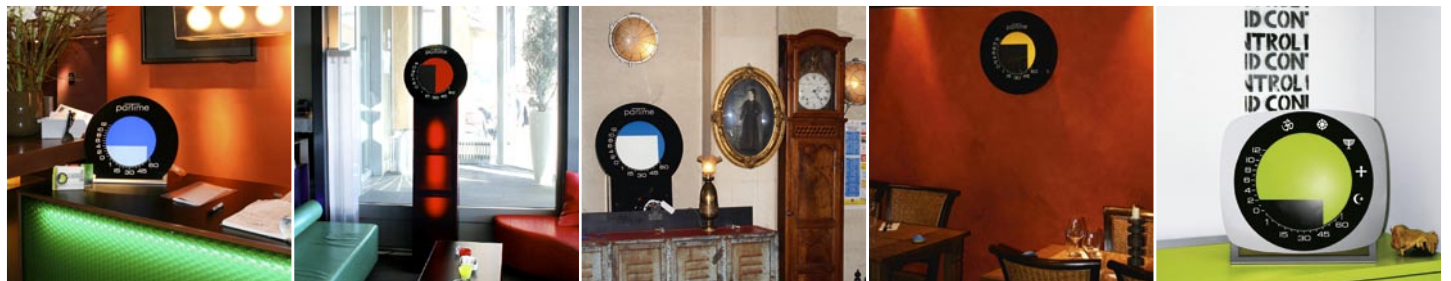
2007: Entwicklung neuer Prototypen und Bekanntmachung des Designs in Zürich.