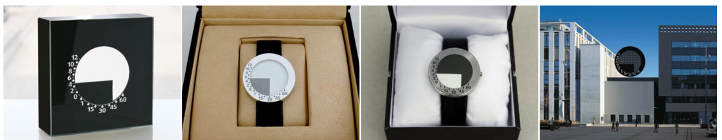
2009: Modell 1x1 und Armbanduhren. Konzept Sonnenuhr: Schablone mit solarbetriebenen-Magnetklappen.