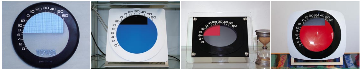
2006: Fertigung 1. Prototyp: Ur-Version Modell Technopark. Designstudien und interne Testphase.