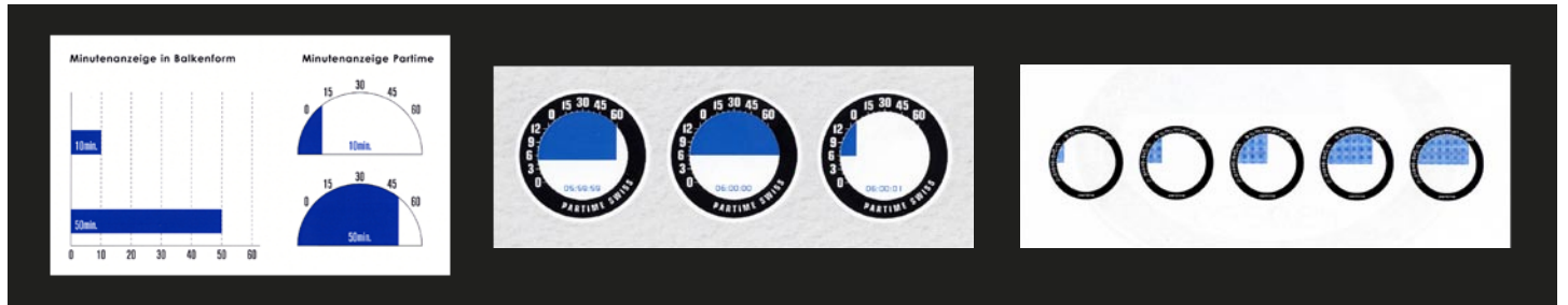
2004: 1. Konzept mit einfachen Visualisierungen und möglichen Ansätzen für Partime, die Zeit als Bild.